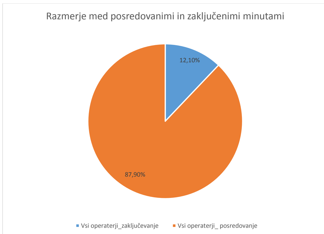
Slika 3: Prikaz količine posredovanih in zaključenih minut pri fiksni operaterjih

zaključevanja klicev, ki jo je agencija izračunala v višini 0,0114 EUR/min (na sliki 2 zelena barva). Iz slike lahko vidimo, da mobilni operaterji v Sloveniji plačujejo za zaključevanje klicev tujim EU operaterjem v povprečju kar za 3,6-krat višjo ceno, kot jo lahko zaračunajo po odločbi agencije.